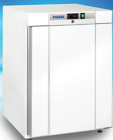
K 200 LUSO