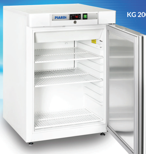
KG 200 LUSO