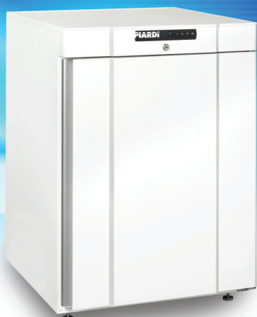
K 200 BASE