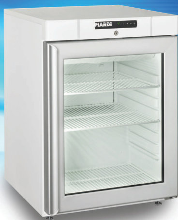
KG 200 BASE